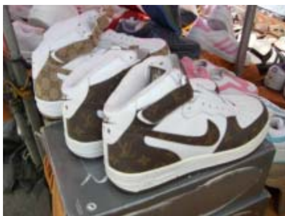
某LVな高級ブランドと某G高級ブランドのロゴの入ったスニーカー

竜頭山公園から国際市場に戻り、昼ごはんを食べるところを探していると、こんなものを発見しました。